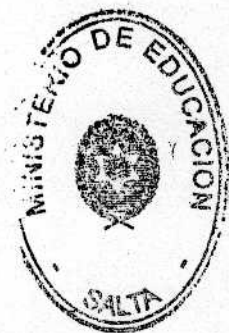
Prof. MARIA ESTER ALTUBE Ministra de Educación Provincia de Salta

6.- Culminación de estudios. El alumno que haya aprobado los espacios curriculares adeudados obtendrá su Certificado de culminación de estudios Secundarios o equivalente según el Plan de Estudios de origen.